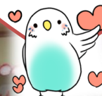
河野先生の ギターに合わせ 気持ちも一つ！