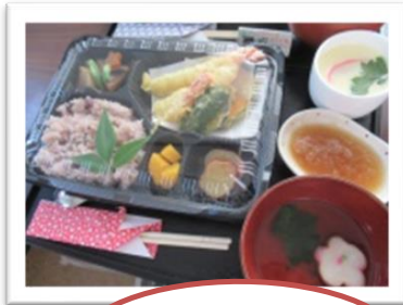
何時も美味しい食事を ありがとう！

天高く馬肥ゆる秋！さわやかで過ごしやすい好季節です。 紅葉を眺めながらドライブに出かけたいですね。 体調管理に気をつけて今月もほのかにいらしてくださいね！